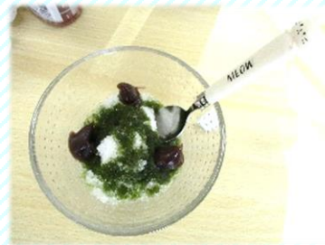
抹茶とあんこのかき氷